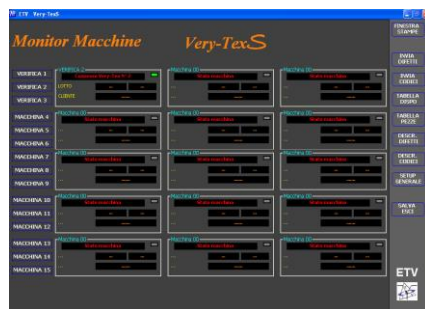
Nosso servidor Very-TexS server pode monitorar as revisadeiras e les visiteuses et e interagir com aplicativos de gerenciamento.