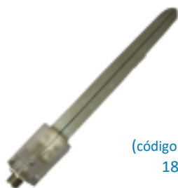
(código: HF7) sonda punhal de 180 mm para dobras