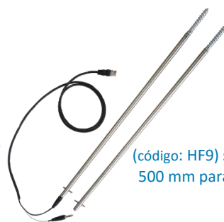
(código: HF9) sonda de agulhas de 500 mm para fardos embalados

" Outros tipos de sonda estão disponíveis sob demanda "