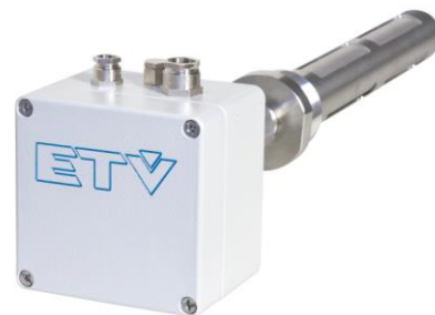
Sonda HYGROAIR com sensor de umidade absoluta (temperatura máxima de trabalho 300°C)