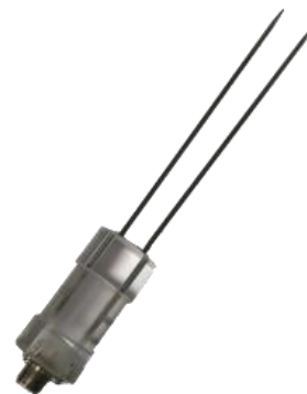
(cod.: HF3) Sonda de agujas 200mm para balas