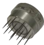
(cod.: HF4) Sonda a sello con agujas para urdimbre