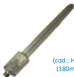
(cod.: HF7) Sonda espada (180mm) para plegado