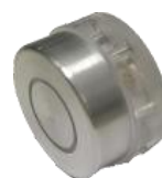
(cod.: HF6) Sonda a sello para material estático