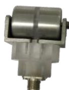
(cod.: HF5) Sonda a rodillos para material en movimiento